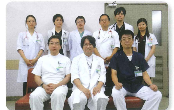
小児科 スタッフ一同

いくつかの問題を抱えつつ着実に発展している予防接種を中心とした予防医学と、疾患として増加しつつあるアレルギー疾患対策を踏まえながら、小児疾患全般に対応できるよう努力したいと考えております。何卒よろしくお願ひ申し上げます。