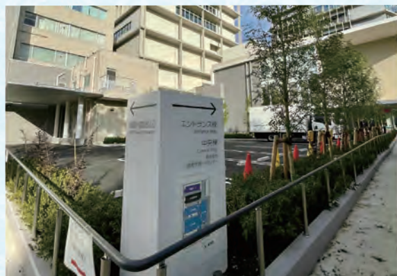
旧安田庭園側からの出入口と中央棟