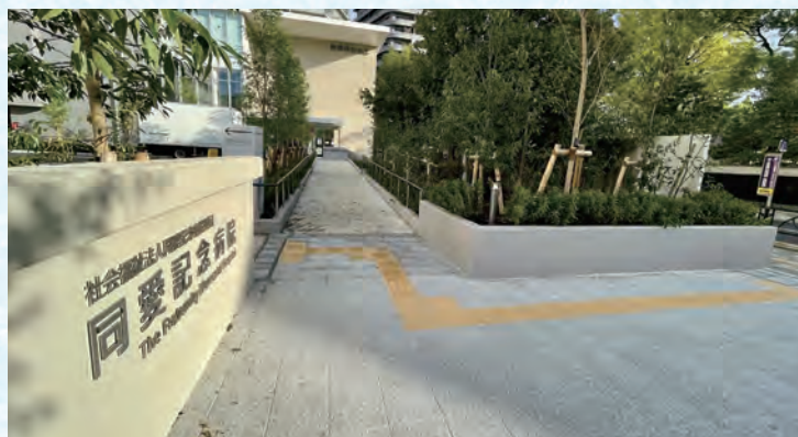
旧安田庭園側からの出入口