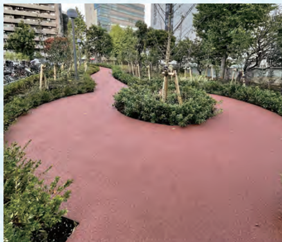
遊歩道のある緑地