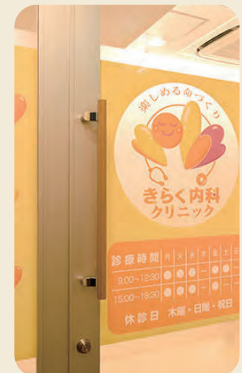
きらく内科クリニック入口