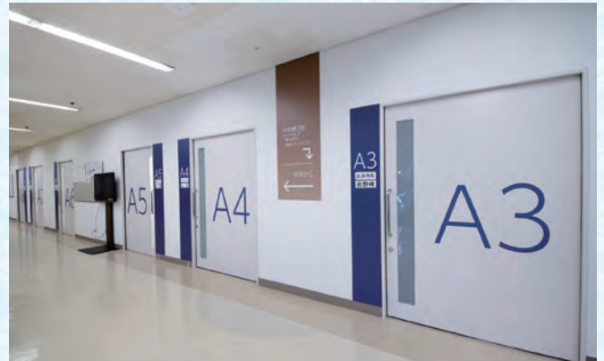
診療棟2階 内科系診察室Aブロック外来(内科系)診察室