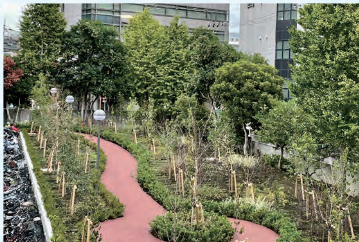
中央棟2階から見た緑地