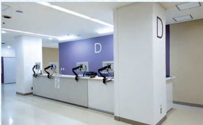
診療棟3階 外科系受付Dブロック外来(外科系)受付