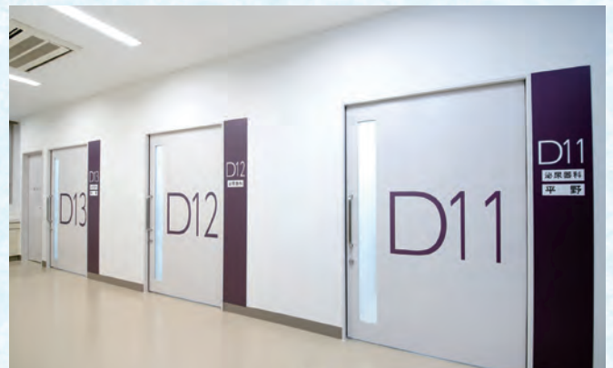
診療棟3階 外科系診察室Dブロック外来(外科系)診察室